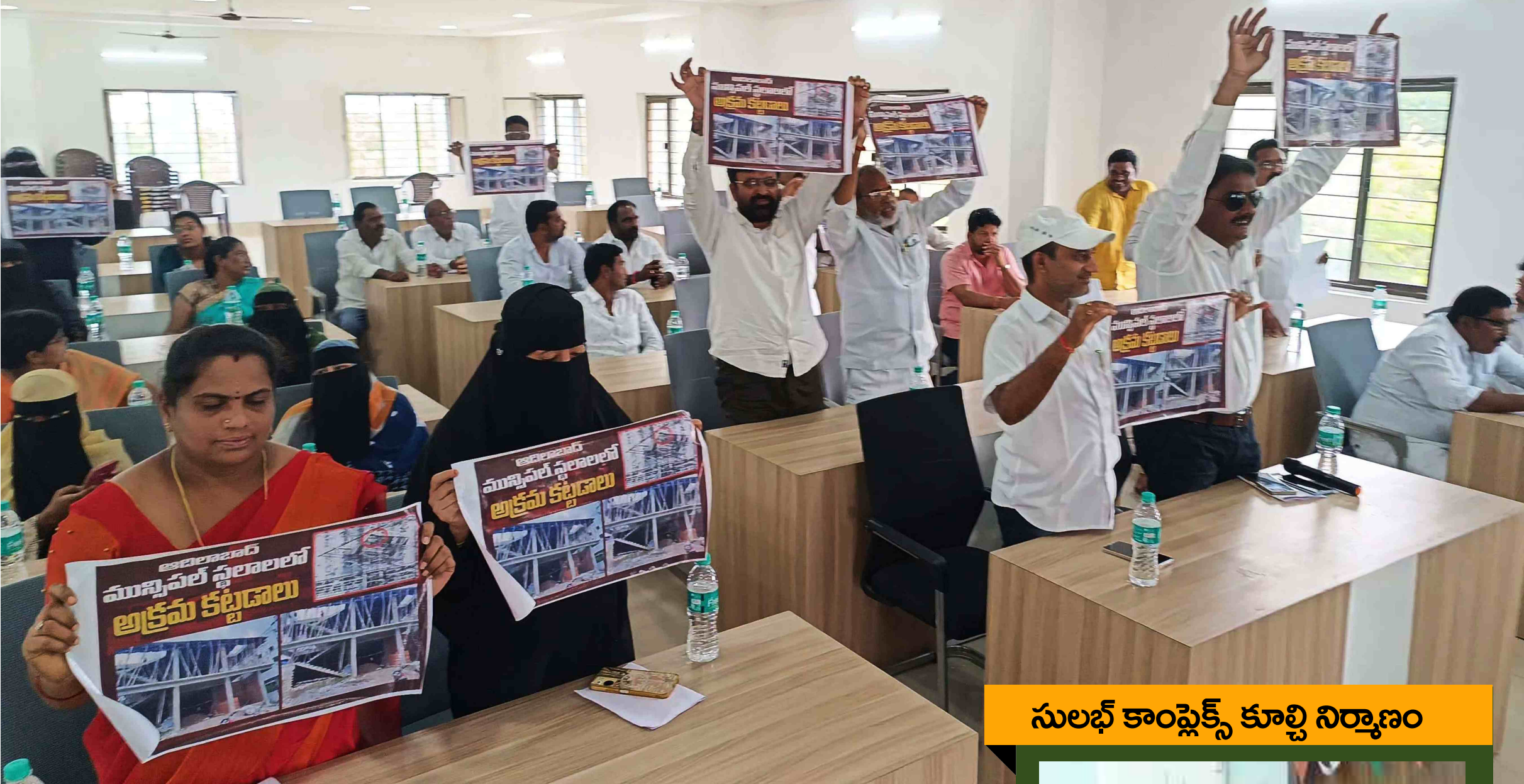
సులభ్ కాంప్లెక్స్ కూల్చి నిర్మాణం