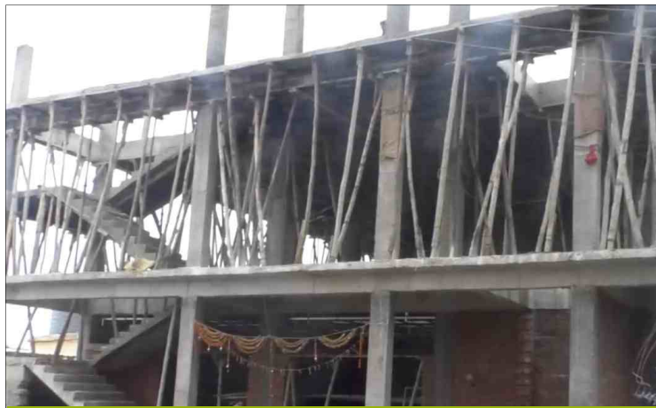
లే అవుట్ ప్రకారం వదిలేసిన స్థలంలో కొన సాగుతున్న భవన నిర్మాణం

ఆదిలాబాద్ అమ్మన్యూస్ ప్రతినాది: ఆదిలాబాద్ జిల్లాకేంద్రంలోని మున్సిపల్ కార్పొరేషన్ సమావేశ మందిరంలో శనివారం నిర్వహించిన కౌన్సిల్ సమావేశం రసాభాసాగా జరిగింది. సమావేశం ప్రారంభం కాగానే కాంగ్రెస్ కౌన్సిల్ సభ్యులు నిల్పిన బల్లియా పరిధిలో అక్రమణలు, అక్రమ కట్టడాల అంశాలపై లేవనెత్తారు. విచారణ జరిపి అక్రమార్కులపై చర్యలు తీసుకోవాలంటూ డిమాండ్ చేశారు. ప్లకార్డులు ప్రదర్శించి నిరసన వ్యక్తం చేశారు. అక్రమార్కులకు వ్యతిరేకంగా పెద్దపెట్టున నినాదాలు చేశారు. దీంతో సభలో ఒక్కసారిగా గందరగోళం నెలకొంది. మున్సిపల్ చైర్మన్ చర్చిద్దామని చెప్పగా సభ్యులు ఆగకుండా ఆందోళన కొనసాగించారు. అధికారులు దీనిపై సమాధానం చెప్పాలంటూ పట్టుబట్టారు. బీజేపీ సభ్యులు అటు ముందుగా ఎజెండా అంశాలపైనే చర్చ జరపాలంటూ చైర్మన్ హోదీయం వద్దకు వెళ్లి నిరసించారు. సభ్యుల నిరసన నినాదాల మధ్య సభ ఒక్కసారిగా హీటెక్కింది. చైర్మన్ సభ్యులకు సర్దిచెప్పి ఎజెండాను ప్రవేశపెట్టగా కౌన్సిల్లో అనేక సమస్యలపై, అంశాలపై నిలదీశారు. అధికారుల పనితీరుపై తీవ్రస్థాయిలో మండిపడ్డారు. ముఖ్యంగా బల్లియా పరిధిలో అనేక స్థలాలు ఉన్నప్పటికీ వాటిని పరిరక్షించడంలో విఫలం అవుతున్నారని ధ్వజమెత్తారు. తాంసీ బస్టాండ్ సమీపంలో మున్సిపాలిటీకి చెందిన ఖాళీ స్థలాన్ని దర్జాగా అక్రమించి ప్రస్తుతం అక్కడ నిర్మాణం చేపడుతున్నారని ఆరోపించారు. 20 ఏళ్ల కిందట లేఅవుట్ చేసిన సందర్భంలో కొంత ఖాళీ స్థలాన్ని వదిలేశారన్నారు. ఆ స్థలంలోనే ప్రజల అవసరాల దృష్ట్యా సులభ్ కాంప్లెక్స్ నిర్మాణం జరిపారన్నారు. కోట్లు విలువ చేసే ఆ స్థలంపై కొందరు అక్రమార్కులు కన్నుపడిందని పేర్కొన్నారు. ఆరు నెలల కిందట సులభ్ కాంప్లెక్స్ను కూల్చివేసి బిల్డింగ్ నిర్మాణం