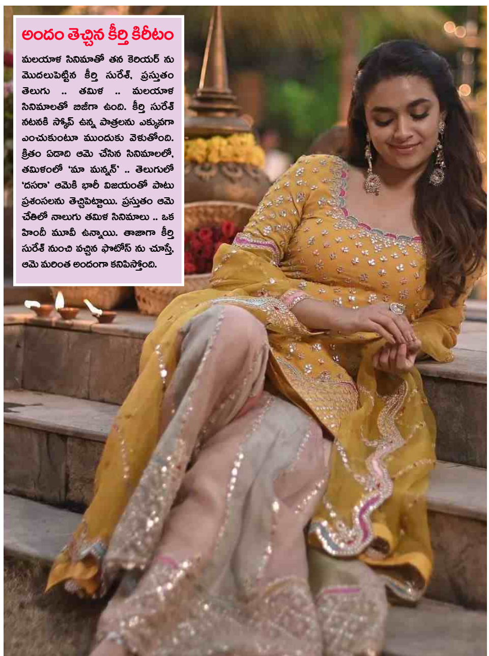
అందం తెచ్చిన కీర్తి కిరీటం మలయాళ సినీమాతో తన కెరియర్ ను మొదలుపెట్టిన కీర్తి సురేశ్, ప్రస్తుతం తెలుగు.. తమిళ.. మలయాళ సినీమాలతో జజిగా ఉంది. కీర్తి సురేశ్ నటనకి సోఫిస్టికేటెడ్ పాత్రలను ఎక్కువగా ఎంచుకుంటూ ముందుకు వెళుతోంది. క్రితం ఏడాది ఆమె చేసిన సినీమాలలో, తమిళంలో 'మా మన్నన్'.. తెలుగులో 'దసరా' ఆమెకి భారీ విజయంతో పాటు ప్రశంసలను తెచ్చిపెట్టాయి. ప్రస్తుతం ఆమె చేతిలో నాలుగు తమిళ సినీమాలు.. ఒక హిందీ మూవీ ఉన్నాయి. తాజాగా కీర్తి సురేశ్ నుంచి వచ్చిన ఫోటోస్ ను చూస్తే, ఆమె మరింత అందంగా కనిపిస్తోంది.