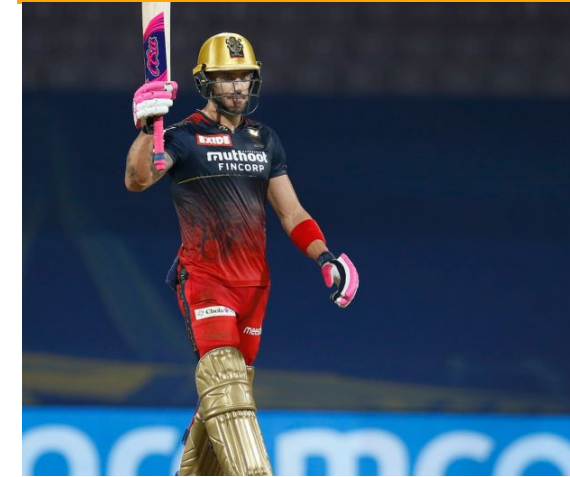
బ్యాట్స్ మెన్ ,బౌలర్లు కలిగిన ఆల్ రౌండ్ జట్టుగా హైదరాబాద్ రెండు వరుస విజయాలు సాధించి హ్యూట్రీక్ విజయం పై కన్నేసింది.

ఐపీఎల్ 2024 సీజన్ -17 లో ఆర్సీబీకి ఏదీ కలసి రావడం లేదు. టోర్నీ లో టైటిల్ ఫేవరెట్ జట్టుల్లో ఒకటైన బెంగళూరు వరుస అవజయాలతో అట్టడుగు స్థానానికి చేరింది. జట్టులో మోస్ట్ ఎక్స్ పీరియన్స్ ప్లేయర్స్ ఉన్నప్పటికీ కొందరు ఫామ్ లేమితో ఇబ్బంది పడుతున్నారు. ప్రధానంగా ఒంటి చేత్తో మ్యాచ్ ఫలితాన్ని తారుమారు చేయగల సత్తా ఉన్న పింట్ హిట్టర్ రైన్ మాక్స్ వెల్ ఆశించిన స్థాయిలో రాణించడంలేదు. ఓపనింగ్ బ్యాట్స్ మెన్ కెప్టెన్ ఫామ్ దుస్థిని ఫామ్ లోకి రావడం కొంత ఆశాజనకం. టాప్ ఆర్డర్ బ్యాట్స్ మెన్ రాణించడం పైనే జట్టు సోల్స్ ఆధారపడుతుంది. చివర్లో కీపర్ అనుజ్ రావత్ ,వివేక్ కార్తీక్ సమయోచితంగా ఆడుతున్నా భారీ సోల్స్ నిట్ చేయలేక పోతున్నారు. బ్యాట్స్ మెన్ , ఆల్ రౌండ్స్, బౌలర్లు సమయోచితంగా రాణిస్తేనే తిరిగి జట్టు విజయాల బాట పడుతుంది. ఆర్సీబీకి ఇకనుండీ ప్రతీ మ్యాచ్ ఇంపాడెంట్ . అయితే వరుస వైఫల్యాల నేపథ్యంలో టీంలో ఏవైనా మార్పులుండే అవకాశముంది. బహుశా ఈ మ్యాచ్ లో ఒకటి రెండు మార్పులతో బరిలోకి దిగవచ్చు. ఏదేమైనా ఇప్పటికైనా ఆర్సీబీ తిరిగి ట్రాక్ లో పడి విజయాలను అందుకోవాలని ఆ జట్టు ఫ్యాన్స్ కోరుకుంటున్నారు.